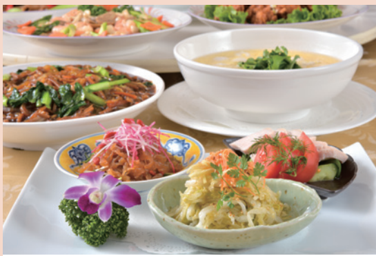
卓盛料理コース 洋食・中華のミックス