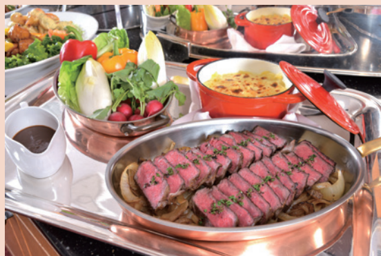
buffet料理コース 洋食・中華のミックス

友人やクラスメイトとの心温まる再会をお手伝いさせていただきます。 下記プラン以外にもお客様のご予算、ご趣旨、ご人数様に応じて承ります、 お気軽にご相談お問い合わせください。